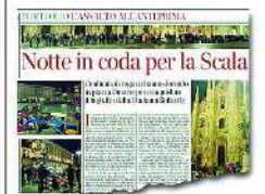
L'articolo Sul «Corriere» di ieri le code di giovani per l'anteprima

ritirando i biglietti che aveva concordato a inizio stagione: su questo tema è previsto un incontro».